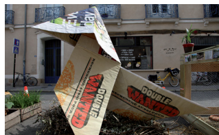
À Nantes : la cocotte de Scopic