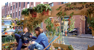
À Lille : Pattou Tandem